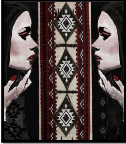
شكل رقم (4) المرأة بعد المعالجة الرقمية