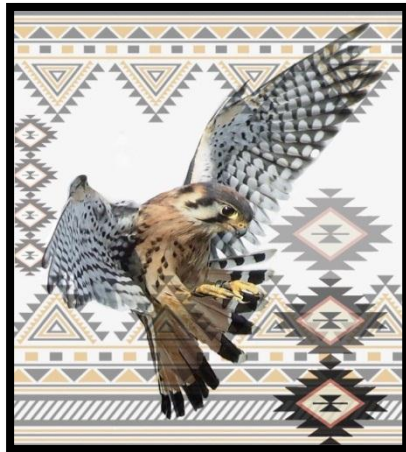
شكل رقم (6) Beautiful Birds بعد المعالجة الرقمية