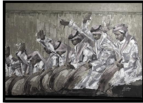
شكل رقم (8) الفرقة الشعبية بعد المعالجة الرقمية