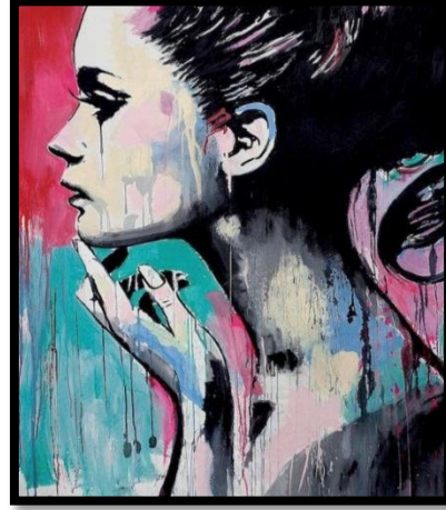
شكل رقم (3) المرأة