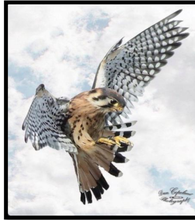
شكل رقم (5) Beautiful Birds