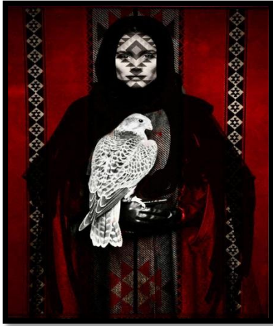
شكل رقم (2) marina بعد المعالجة الرقمية