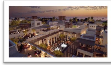
شكل رقم (12)