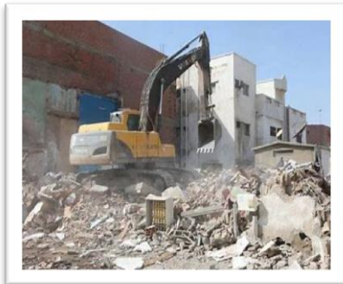
شكل رقم (4)