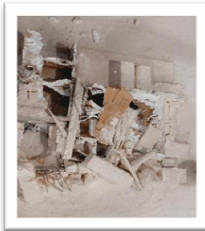
شكل رقم (24)

الخطوة الأولى من عمل الباحثة (تجهيز سطح العمل الفني)