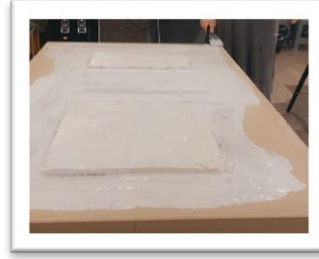
شكل رقم (21)

الخطوة الثانية من عمل الباحثة (تجهيز الخامات الملائمة للعمل)