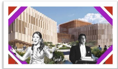
شكل رقم (17)