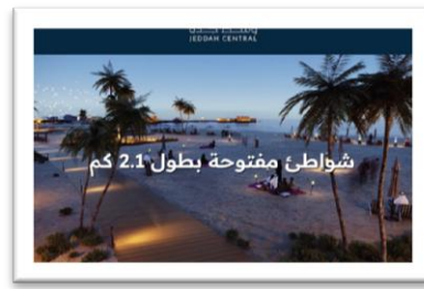
شكل رقم (14)