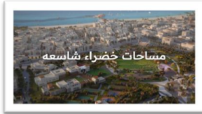
شكل رقم (13)