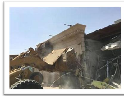
شكل رقم (1)