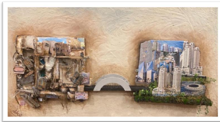
شكل رقم (25)

الخطوة الثالثة من عمل الباحثة (الاستمرار في تجريب الخامات)