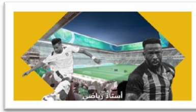
شكل رقم (19)