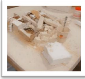
شكل رقم (22)

الفكري للفنان وهذا الاتجاه في البحث الحالي قائم على توضيح مشكلة الهدم والبناء والتطوير لوسط مدينة جدة مستندا على فلسفة القبح والمتوالد من الجمال، واعتمادا على رؤية المملكة العربية السعودية 2030. الجانب التطبيقي: قامت الباحثة بتنفيذ العمل الفني كما هو موضح في الأشكال من رقم (21) إلى رقم (25) من خلال الخطوات التالية: