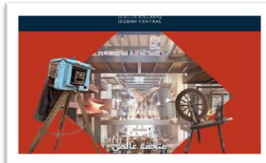
شكل رقم (17)