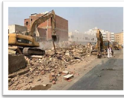
شكل رقم (3)

https://www.slaati.com/2020/6/3/p1666265.html