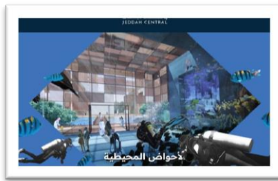
شكل رقم (15)