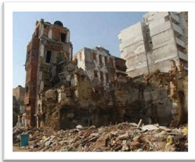
شكل رقم (2)

أحد معالم مدينة جدة على مدار 40 عاماً الماضية والتي يتم المحافظة عليها كأهم وأول المتاحف الصناعية في المملكة العربية السعودية. - يحتوي متحف تحلية المياه على منطقة الثقافة والابتكار والاستدامة، كمركز مزدهر للتشجيع على تطوير الفن وصون الإرث الثقافي، وتحفيز الابتكار ووضع الاستدامة من أولويات جميع القطاعات ورجال الأعمال. - تحويل الممر البحري المهم إلى شاطئ رملي بحيث يتم تطوير منطقة وسط جدة، وتحديد الممر المائي، لأماكن للاستجمام والترفيه لجميع الفئات من المجتمع، لذا سيتم إنشاء هذه المنطقة بممرات مشاة وشواطئ مفتوحة على الواجهة البحرية بالإضافة لتوفير جميع الخدمات التي يحتاجها المقيم والزائر، وتستهدف هذه المنطقة تعزيز الاتصال المباشر بين الإنسان، المجتمع، المكان، البحر، الرمال، والمناطق السكنية المؤهلة كجزء من تحسين جودة الحياة. والعديد من المشاريع الأخرى التي تتضمن المتاحف ومراكز للأنشطة الاجتماعية والثقافية والصحية، ومعامل المختبرات، والفنادق والمنتجعات، حدائق ومنتزهات ترفيهية ورياضية، منطقة شواطئ ونشاطات بحرية، مرسى لليخوت الخاصة والقوارب، منطقة مركزية للأعمال والابتكار (وسط جدة، 2023)