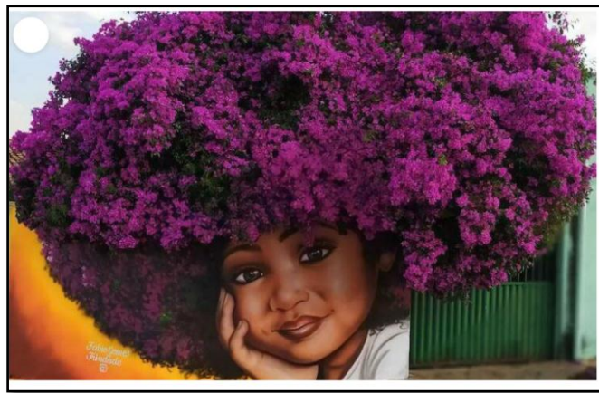
شكل رقم (3)