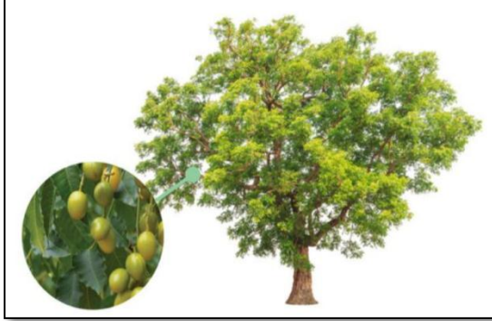
شكل رقم (1) يوضح شجرة النيم وثمارها

تصبح شجرة النيم كبيرة الحجم وقد تصل ارتفاعها إلي حوالي عشرة أمتار عندما يكبر عمرها فهي تصنف ضمن أشجار الظل ، لانتشار توزيع فروعها التي تغطي مساحة كبيرة، لذا تكثر زراعتها في الحدائق والشوارع، وتكون أوراقها مركبة، تخرج علي شكل مجموعة في نهاية الفروع الخضرية الصغيرة لهذه الشجرة، وتتكون ورقة النيم من 12 - 16 وريقة شكلها كالسيف ، وحوافها مسننة ومتقابلة في ترتيبها ، و تزهر شجرة النيم في بداية شهر أبريل و ازهارها بيضاء اللون كروية الشكل ، ومحصولها وفير وتحتوي كل ثمرة علي بذرة واحدة وبها نسبة مرتفعة من الزيوت التي يتم استخلاصها عن طريق الضغط. شكل رقم (1) . ( لبنية، 2004).