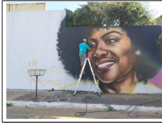
شكل رقم (2)

https://www.instagram.com/fabiogomestrindade/