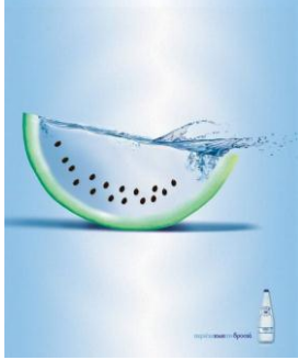
شكل رقم (14)

وقد يستعمل اللون في غير موضعه المتعارف عليه للتأثير في المتلقي وجذب انتباهه، والعقل البشري يدهش من هذه التقنية الغريبة للون ليكون في مثل هذه الحالة لتفعيل عملية التأويل بغية تفسير سبب الغرابة تلك، لاستنتاج المعنى المقصود. (الصقر، ايراد: 2003، ص 89)