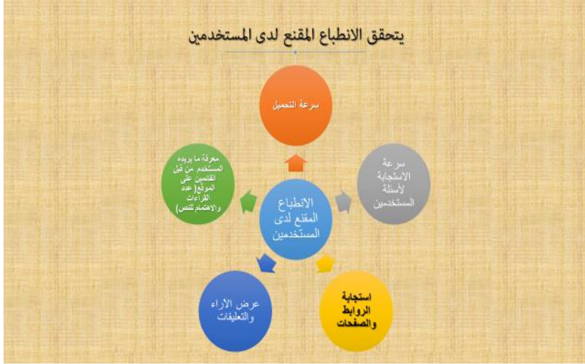
الشكل (2) من تصميم الباحثة يوضح كيفية تحقيق الانطباع الأول للمستخدم عن المواقع الالكترونية

وعناصر الاقناع البصري تتمثل في مفردات اللغة البصرية التي يستخدمها المصمم الكرافيكي وسميت بالعناصر نسبة الى إمكاناتها المرنة في اتخاذ أي هيئة مرنة وقابليتها للاندماج مع بعضها لتصبح شكلاً واحداً متناسقاً. والاقناع البصري هو علاقة ناجحة بين الشكل والوظيفة، أي ان الاقناع البصري يكشف عن ثقافة الذوق في الحس التصميمي والمضمون والثقافات الأخرى.