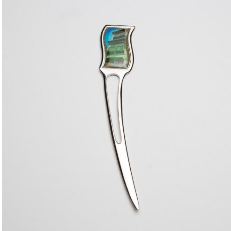
صورة رقم (2)