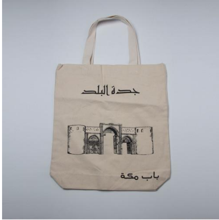
صورة رقم (1)