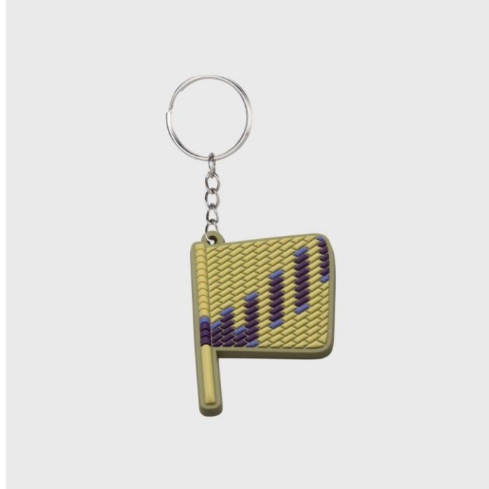
صورة رقم (6)