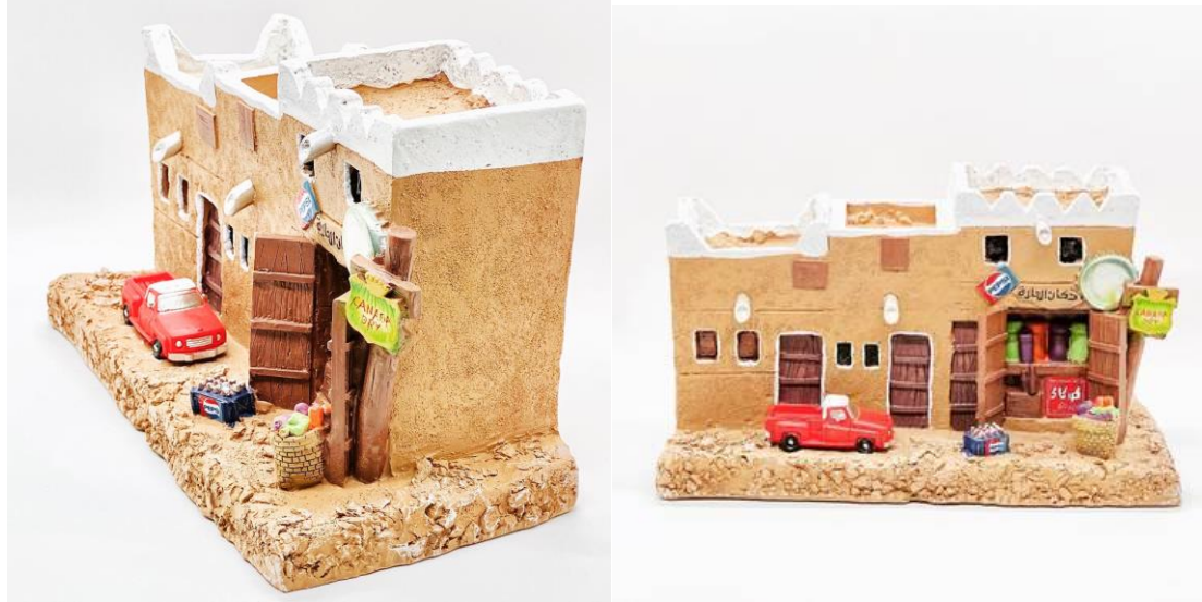
صورة رقم (8)