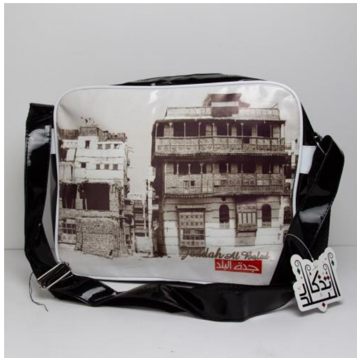
صورة رقم (4)