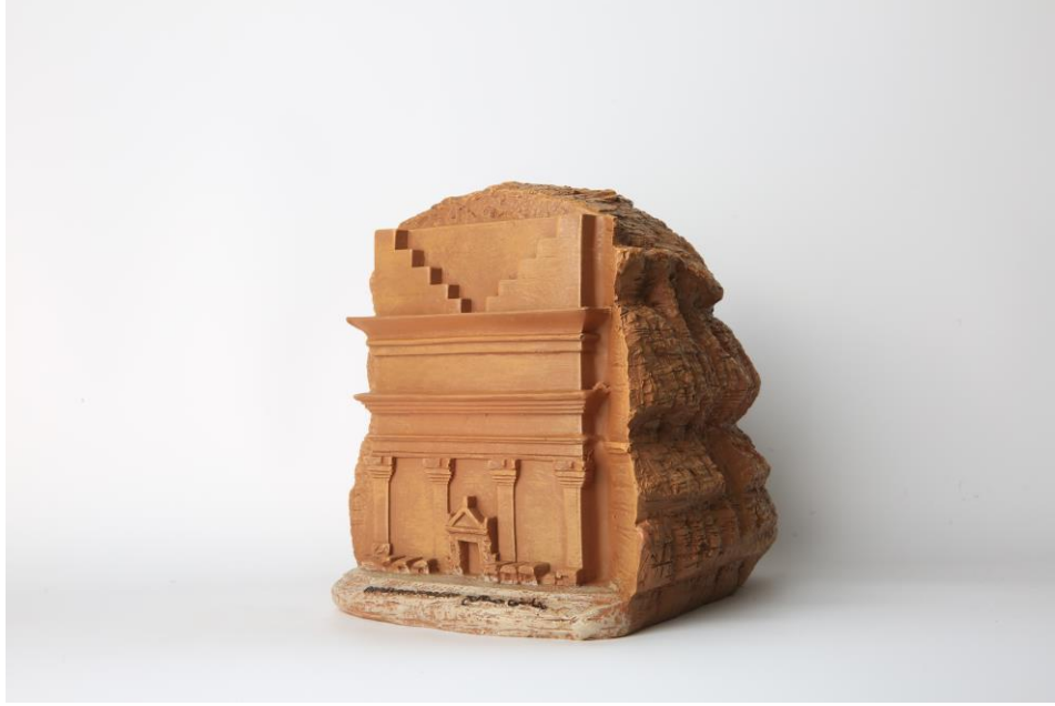
صورة رقم (7)