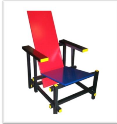
شكل رقم (2)