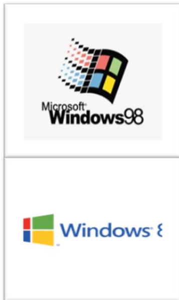
شكل رقم ( 4 )

الشكل الخالص في التصميم هو الشكل القادر على الاتصال ، ووفق ال دي ستيل يتمثل الشكل بالإبتعاد عن الإتجاه الطبيعي، وتتنظر في العلاقات بين العناصر التركيبية في بنية داخلية تتميز بترابط عناصرها واتساق أجزائها، لذا فالتصميم يذهب الى " تخفيض الشكل من أجل العثور على جوهر الشكل أو اللون أو النمط " ((7)) ، كما في الشكل رقم (4) حيث قام المصمم بالتركيز على الحرف لإبراز الفكرة وإعتماداً على بنائية موندرريان ، حيث جاء تمثيل الأشكال في تجريد هندسي إبداعي خالص ، فكانت الأشكال أنموذجاً للوعي الفني الجديد، فهي مزيج من التكافؤ والديناميكية والنقاء والبساطة والوضوح من خلال علاقة الحروف بالتكوينات الهندسية، فأنتج ذلك تغييراً جذرياً في الأشكال التي حولت الصور العادية إلى تراكيب ممتلئة بحيوية الألوان التي استخدمها المصمم في بناء اللوحة الفنية، لذا ركزت ال دي ستيل على " تدمير الأشكال القديمة بشرط إنشاء أشكال جديدة ذات قيمة اتصالية مبتكرة " ( Padovan: 2010, p4 ) ، ما يعني ضمناً تحويل الصورة العرضية للواقع وإعادة تشكيلها لإيجاد شكل أنقى من السابق ، وتطبيقها على