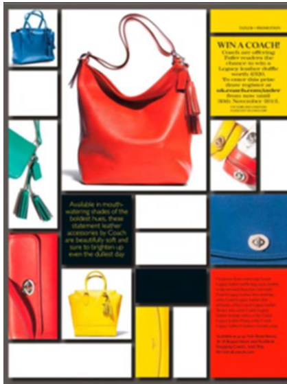
شكل رقم ( 3 )

يعتبر التجريد الهندسي من أهم مبادئ ال دي ستيل وأعدها في تنفيذ "الرسم التمثيلي التشخيصي إذ إنه فن التعبير الأنبي لحركة العاطفة والروح وفن التعبير عن الرؤى والحساسية الأستيطيقية العالية" (علي : 2011 ، ص 69 ) ، أي أن الأشكال بدأت في تكوين حياة خاصة بها نتيجة التجريد الهندسي وأصبح ثقافة بصرية تعتمد على الأسس الرياضية التي شكلت العلاقات الكونية أما قاعدة الألوان المتناقضة فكانت مرتبطة بالتعبير البيئي ، فضلا عن توسيع حالة التوازن والمساحات المفتوحة في "التجريد ، بساطته ، التدفق الحر ، حيث أصبح الفضاء ضرورياً للثقافة المرئية الحديثة" ((6)) ( Moore : 2017 p36) ، وغالباً ما تعبر عن التواصل والتكامل مع العناصر المختلفة عبر حدود العمل الفني كما في الشكل رقم (3) ، حيث ذهب المصمم الى اتخاذ لوحة موندرريان كوسيلة للإعلان ومحركاتها في عرض المنتج(الحقائب النسائية)، مستغلاً الفضاءات البيضاء في اللوحة لإدراجها فيها، وجاء العرض بأسلوبين مختلفين، مرة يظهر المنتج بشكل كامل وإعتماداً على المساحات الكبيرة والتي تعتبر مركز من مراكز الجذب البصري في بنية الإعلان ، ومرة يتم عرض أجزاء منها لتحل محل الألوان الأساسية الموجودة أصلاً في العمل الفني ، هذا التركيب الداخلي في عرض المنتج بإسلوب ال دي ستيل حقق شكلاً جديداً من الإنتفاح البصري نحو الخارج ، مما يجعل ال دي ستيل نموذجاً للاتصال مع المتلقي وفق المعطيات والسمات التي تتميز بها والأشياء التي عرفت عنها.