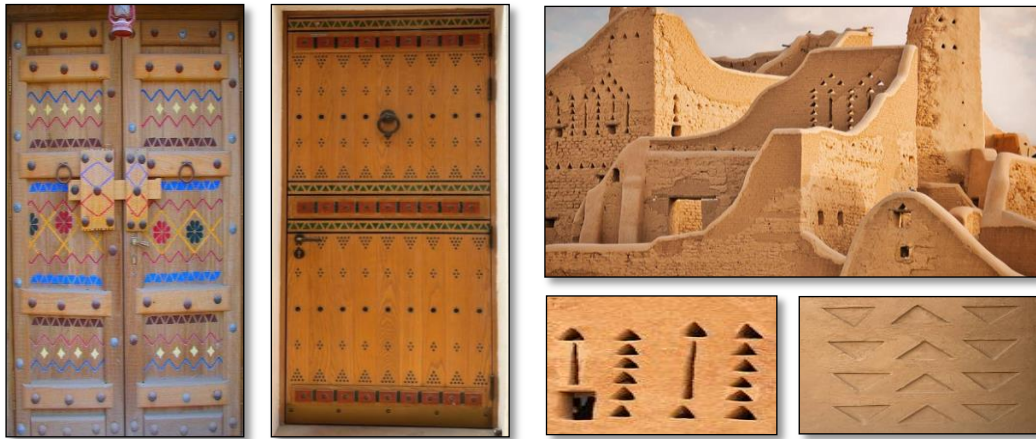
شكل (2) زخارف الأبواب النجدية

زخارف المنطقة الوسطى: تتميز البيوت في منطقة نجد بأنها مهابة للظروف الدينية، والاجتماعية، والثقافية، والاقتصادية، والطبيعية المحيطة، فروعياً فيها وجود عناصر دفاعية؛ كالسقاطات، والمزاغل (الفتحات) على واجهات المنازل. كما أن كتلة البناء مرتفعة وضخمة، وكذلك سمك جدرانها؛ إذ كانت المباني من الخارج تعتبر بسيطة قليلة الزخارف والنقوش شكل (1) إلا أنها من الداخل غنية بالزخارف والنقوش الهندسية الرائعة، كذلك تستخدم الألوان المختلفة في تزيين الأبواب والنوافذ والأسقف، مما يضفي على المنزل البهجة وسط البيئة الصحراوية من حوله. شكل (2) (شطا، 2007)