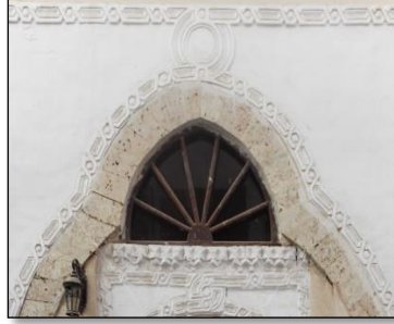
شكل (9) الزخارف الجصية

بالرواشين والمشربيات ذات النقوش الخشبية الجميلة شكل (8)، كما تمتاز بكثرة الزخارف الجصية المشغولة حول الأبواب بشكل عقود مدببة أو مستديرة. شكل (9) (باهيم، 2000).