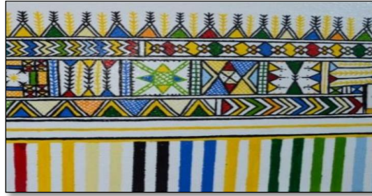
شكل (3) زخارف القط العسيري

زخارف المنطقة الجنوبية: تُكون الزخارف الجدارية للمنطقة الجنوبية وخاصةً في عسير بمسمى "فن القط" أو النقش الذي عرفته عسير منذ أكثر من ثلاثمائة عام والذي يمثل أحد أشهر الفنون التقليدية العمرانية للمنطقة الجنوبية في المملكة العربية السعودية ويعتمد هذا الفن على الأشكال الهندسية المختلفة؛ منها: المثلثات، والمربعات، والدوائر، والخطوط المتعاقبة على امتداد الغرفة بألوان مختلفة؛ معظمها مستمد من البيئة المحلية، حيث يعتمد هذا الفن بشكل كبير على الألوان الأساسية منها الأحمر والأصفر والأخضر والأزرق والأسود. (القطاني، 2019، 82) وما يميز فن القط هو "عدم التكرار" و "الحركة" التي يعقبها سكون، فالخطوط المستمرة على الجدران التي تحدد مساحة المشغولات الجدارية حيث تضيء هذه الزخارف بأشكالها وألوانها المختلفة على المنزل قدرًا من الجمال والبهجة، كما تبرز دور المرأة ولمساتها في البناء. (مرزوق، 2010، 100)