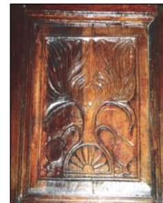
شكل (4) شجرة الرمان شكل (5) ورقة التين شكل (6) البيدانة شكل (7) جذع النخلة وسعفها

زخارف المنطقة الغربية: زحرت العمارة التقليدية في منطقة الحجاز (مكة المكرمة - جدة) بالعديد من العناصر والوحدات المعمارية التي لازمت نشؤها وتطورها، وكان وراء وجود كل عنصر من هذه العناصر فكر معين وفلسفة خاصة به. حيث امتازت زخرفة التراث العمراني في منطقة الحجاز باتساع الفتحات الخارجية المغطاة