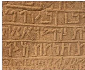
شكل (11) نقوش صخرية

كما تمثل الغلا التابعة لمنطقة المدينة المنورة ملتقى قديم للطرق بين القارات؛ وموطناً للعجائب الثقافية والمواقع التاريخية التراثية، فهي تعكس براعة الإنسان في الابتكار وتسخير البيئة من أجل البقاء والتبادل الثقافي. (بابلي، 2020)، وتعتبر الحجر (مدائن صالح)، أول مواقع المملكة العربية السعودية المسجلة ضمن قائمة اليونسكو لمواقع التراث العالمي التابعة لمدينة الغلا، فهي مدينة من مدن النخوم الجنوبية للمملكة النبطية حيث اكتسبت شهرتها العالمية بفضل المدافن الصخرية ذات الواجهات الضخمة شكل (10)، والنقوش الصخرية القديمة شكل (11). (نعمة، وآخرون، 2010)