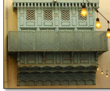
شكل (8) الزخارف الخشبية للرواشين

كما تمثل الغلا التابعة لمنطقة المدينة المنورة ملتقى قديم للطرق بين القارات؛ وموطناً للعجائب الثقافية والمواقع التاريخية التراثية، فهي تعكس براعة الإنسان في الابتكار وتسخير البيئة من أجل البقاء والتبادل الثقافي. (بابلي، 2020)، وتعتبر الحجر (مدائن صالح)، أول مواقع المملكة العربية السعودية المسجلة ضمن قائمة اليونسكو لمواقع التراث العالمي التابعة لمدينة الغلا، فهي مدينة من مدن النخوم الجنوبية للمملكة النبطية حيث اكتسبت شهرتها العالمية بفضل المدافن الصخرية ذات الواجهات الضخمة شكل (10)، والنقوش الصخرية القديمة شكل (11). (نعمة، وآخرون، 2010)