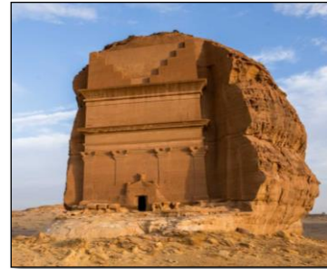
شكل (10) مدافن صخرية