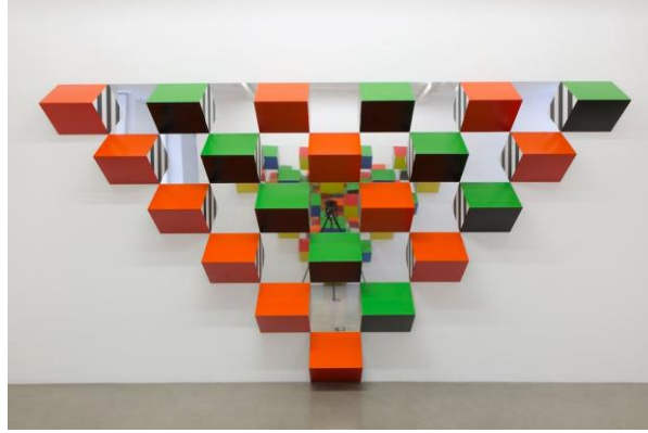
صورة رقم (3): تصميم معرض Pyramidal, haut-relief, travail in situ - A 2, 2017

وتشير دراسة Melanie Thekala ميلاني تيكالالا (2020) بعنوان "الانتقال من خلال الصور: المشاهدة وإنتاج المعنى في بيئات فنية متعددة التخصصات". والتي تبين فهم التجربة المجسدة في بيئات فنية غامرة من خلال فحص الأعمال الفنية التي تنشر اتفاقيات متعددة التخصصات لتحويل الانتباه نحو المتفرج نفسه إلى ما يتم عرض في المعرض والمتحف، وتطوير فهم أكثر دقة لكيفية إنتاج تفاعل المتفرج اليقظ مع الأعمال الفنية في المعرض من خلال تركيب وتثبيت العرض الفني داخل المعرض والمتحف وتنظيم القيم في الفنون لها. واهمية تصميم المعرض والتكنولوجيا بالمعارض والمتاحف. تحديد مكان المتفرج في الزمان والمكان.