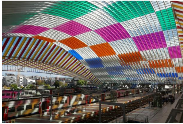
صورة رقم (2): تثبيت تركيب فني Gare de Liège-Guillemins، 2022

يتضمن كل من تثبيت التركيبات الفنية وتصميم المعرض الفرق وهو تحويل الفضاء والمساحات إلى التغيير في تصور الواقع للزوار. حيث ذكر فابيانسكي (Fabiansky) (2021) أنه بدأ مصطلح التركيب الفني وتصميم المعارض كمصطلحات منفصلة لم تتقارب إلا في السنوات الأخيرة. لفهم الفروق الدقيقة بين التركيبات الفنية وتصميم المعارض تماماً، يجب على المرء مقارنة أوجه التشابه الحالية بينهما، ثم العودة بالزمن إلى الوراء ليرى كيف تم التمييز لأول مرة. واطاف فابيانسكي بضع نقاط إلى ما سبق أن تصميم المعرض، كما يوحي الاسم، هو تصميم أو هندسة المكان والوقوف حول كيفية تصميمه اما يكون تصميمًا ثلاثي الأبعاد مع جميع التفاصيل الضرورية للمكان. وعندما يكون الإعداد هو جزء التنفيذ من التصميم، والذي يتطلب مهنيين / عمال ماهرين لبناء المكان الفعلي لجلب التصميم (على الورق والكمبيوتر) إلى الحياة الواقعية في أرضيات متساوية. وهذا كما ميز به الفنان دانيال بورين (Daniel Boren) في مقاله الشهيرة عام 1971 بالتمييز بين (التركيب الفني) و(تصميم المعرض) ووضحه بالصور التالية من المصدر mennour.com/artists/daniel-buren