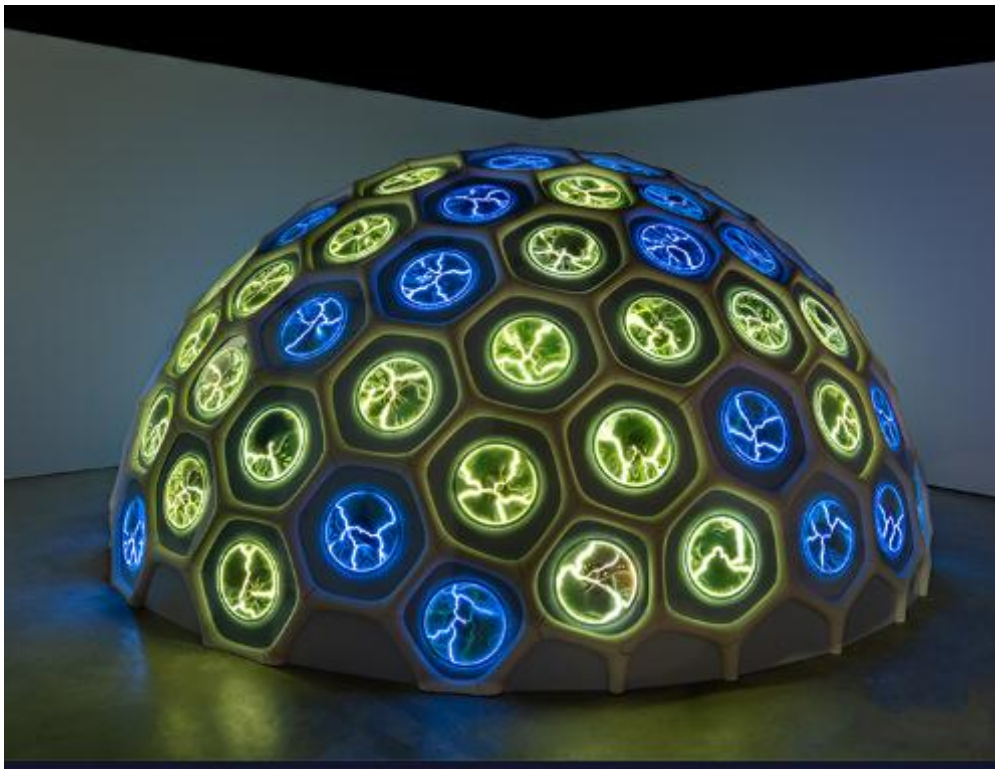
شكل(4) مريم طارق، الوعي الجمعي، 2022، نور الرياض.

https://riyadhart.sa/ar/artworks/%d8%a7%d9%84%d9%88%d8%b9%d9%8a-%d8%a7%d9%84%d8%ac%d9%85%d8%b9%d9%8a-2022