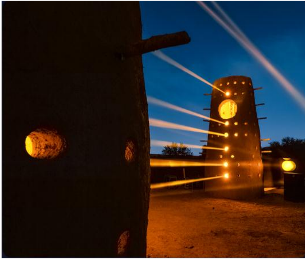
شكل (3) عهد العمودي، أطيايف اليوم والغد، 2022، نور الرياض.