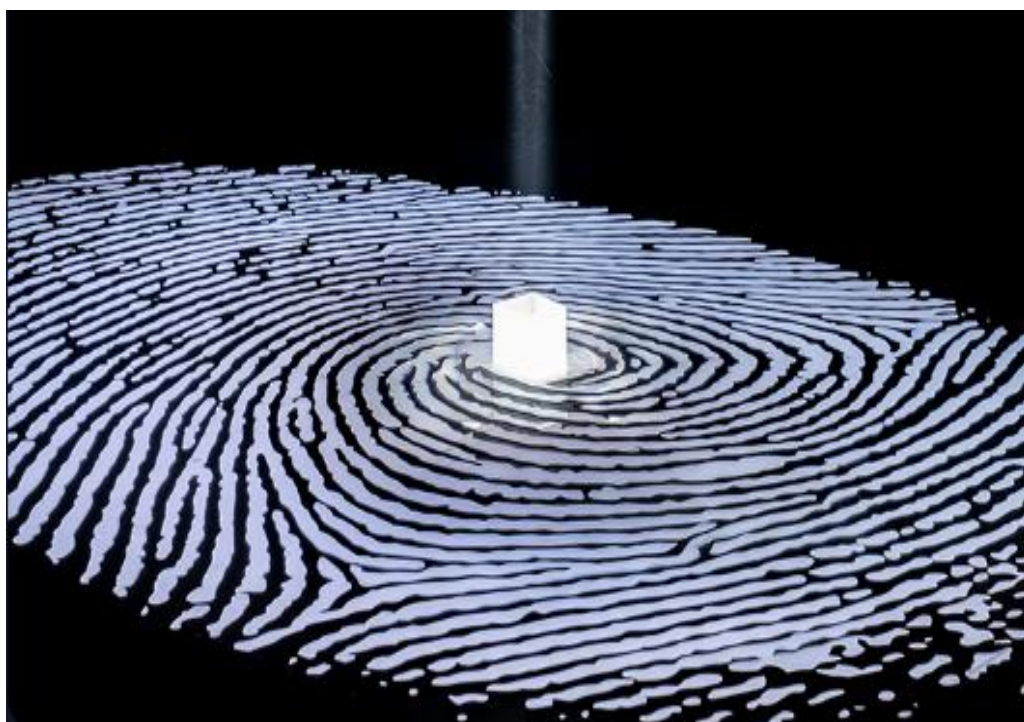
شكل (٢) سعد الهويدي، على الفطرة، 2022، أشعة ليزر، نور الرياض.

https://riyadhart.sa/ar/artists/saad-al-howede