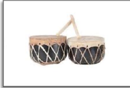
صورة رقم (6) آلة الزير

تعدد الآلات الموسيقية التقليدية الجبلية في المملكة العربية السعودية، بتعدد أصنافها وفصائلها، والرقصات الأدائية المصاحبة لها، إلا أن هذه الفنون " تعتمد بصفة أساسية على أداء الصوت البشري للألحان التي توارثها الأجيال جيل بعد جيل" إلا أن الإرث للفنون الأدائية الجبلية يضم العديد من الآلات الإيقاعية. وتتميز الموسيقى التقليدية للفنون الأدائية الجبلية بتنوع ألحانها الإيقاعية ذات المنابت العربية، وتنوع المواد الأولية التي تصنع منها، الأخشاب إلى جانب جلود الحيوانات التي تستخدم ككساء للطبول بأنواعها المختلفة منها الماشية (الماعز، والأبقار) المدبوغة. ■ آلة (الزير) تصنع من جلود الماشية المدبوغة توضع على زير من الخشب أو الفخار، ويتم وضعه على النار حتى يشتد ويضرب عليه بالعصي فيصدر أصواتاً عالية تسمع من بعيد.