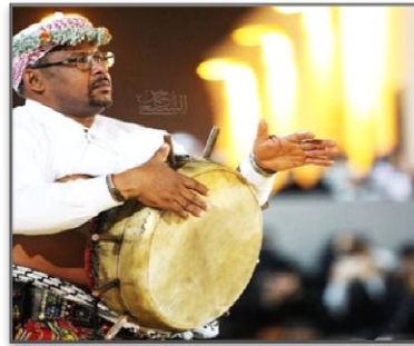
صورة رقم (7) آلة الزلفة

■ آلة (الزلفة) وهي شبيهة بالزير، ولكن الطارق عليها لا يضعها على الأرض مثل الزير، بل على بطنه بعد أن يربطها في وسطه ثم يطرق عليها بيديه وليس بالعصا كما في الزير.