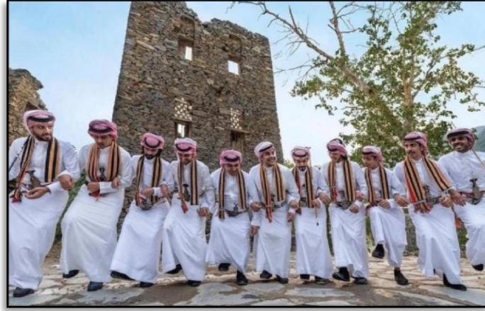
صورة رقم (3) فن الخطوة