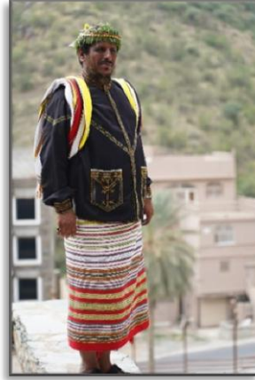
صورة رقم (10) الإزار (المصنف)