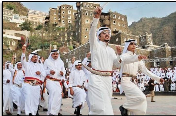
صورة رقم (2) فن العرضة

العرضة: جاءت كلمة عرضة من الاستعراض العسكري السلمي والذي يعتمد على تناسق الأداء والزي وقوة الحضور لدى المجموعة وتقوم العرضة على أساس وجود شاعر أو أكثر بمصاحبة الزير، حولهم صفوف العرضة التي لا تتقيد بعدد محدد، حيث تؤدي الصفوف العرضة وقد حملوا السيوف أو البنادق أو الخناجر على شكل الاستعراض والمشي بخطوة موزونة وبطريقة ثنائية الحركة (كل اثنين بجانب بعض) في حركة دائرية لا تلبث أن تعود لصف واحد دائري الشكل في مواجهة وسط الميدان لمتابعة المزوعين ومحركاتهم في حركات استعراضية وتتوقف لمرحلة البدع والرد من الشعراء وتعود للدوران مرة أخرى وتختلف من منطقة إلى أخرى بل هناك اختلافات في المنطقة الواحدة.