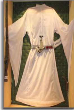
صورة رقم (8) ثوب المفرج