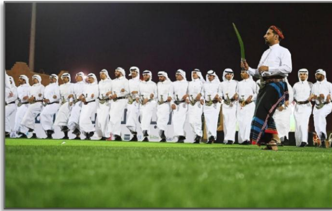
صورة رقم (5) فن القزوعي

يؤدى فن القزوعي بعمل شبة دائرة ولكن منفصلين بصفين متقوسين وينتصفها شاعر عادة وأحياناً شاعرين أو أربع شعراء بحيث تكون المحاوره ثنائية أو رباعية وكل شاعرين يتحاورون على معنى أو موضوع معين وواحد أو اثنين وقد يزيدون أكثر حسب الصفوف من الذين يرتبون الحركة بالنزول وضرب الأقدام ويسمى اللاعب المنتصف (المزيف) أو (المهوز).