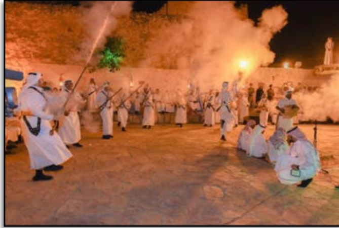
صورة رقم (1) فن المدقال

وهو بارود فقط. وفي نهاية العرض تجتمع كافة المجموعات مشكلين حلقة واحدة يطلقون فيها مقمعاتهم في لحظة واحدة. يلي ذلك تبدأ صفوف العرضة في التشكيل ( https://www.alriyadh.com , 2023).