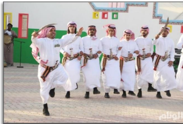
صورة رقم (4) فن الدمه

الدمه: فن فلكلور شعبي عُرفت به منطقة عسير منذ أكثر من 200 سنة مضت، يؤدي هذا الفن صفيين متقابلين يأخذان الصفيين بيتان من الشعر الذي يؤلفه الشاعر بلحن الدمه. يرتدى مصنف وجنيبة وعلى الرأس عصابة وهي ربطة من الروائح العطرية مثل (الشذاب والريحان والشيح والرنجس) وغيرها من النباتات. ويقول معظم المؤرخين ان لون الدمه جاء من كلمة (دم) وتعني دم الشهي وهدمه وساواه بالارض فالدمه يجب ان يكون فيها حماس ولياقة بدنية وهذان العاملان يجب ان يكونا في الذي يريد القيام بها الفن. يقوله الشاعر للصف الأول حتى يحفظه وبعدها يرد عليه شاعر آخر إذا كان هنالك شاعر آخر والم يكن هنالك يذهب هو إلى الصف الثاني ويقول لها بيت من الشعر حتى يحفظوه وبعدها يبدأ الفن بقرع الزلفة والزير. https://ar.wikipedia.org/wiki,2024