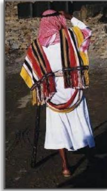
صورة رقم (9) ثوب المذيل المصدر: https://www.alarabiya.net .

يرتدي الرجال في شرق منطقة عسير ثوبًا خاصًا بالعمل في الزراعة، وهو ثوب (المبرم) الذي يتصف بالمتانة والقوة وبالقصر، تتميز بأكمامه القصيرة؛ وذلك ليساعد على الحركة. أما في الشتاء فيلبس الرجل ثوبًا مصنوعًا من القماش المتين المنسوج من أطرافه جميعها يُسمى (اللحاف)، ويقوم بارتداء ذلك الثوب فوق ملابسه.